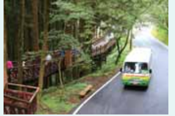
森之道和電動遊園車