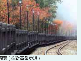
觀葉 (往對高岳步道)