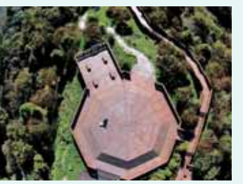
小笠原山觀景臺空拍照